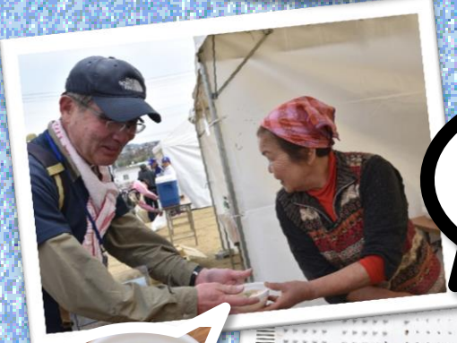
豚汁で ホッと一息。