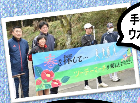
手作りの横断幕で ウォーカーを歓迎!!