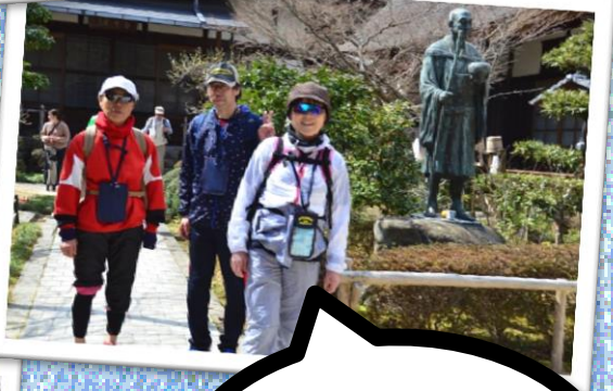
第29回の参加記念品 デニム製のチェックカード入れ を早速使っています!!