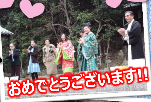
おめでとうございます!!